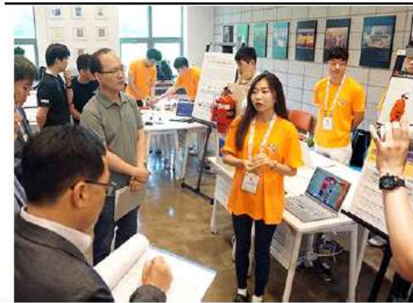
포스터 사전 심사